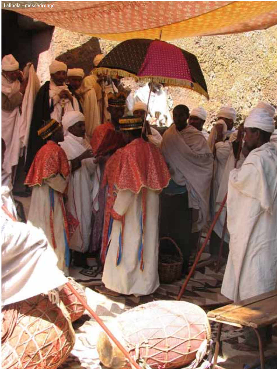
Lalibela - messedrenge