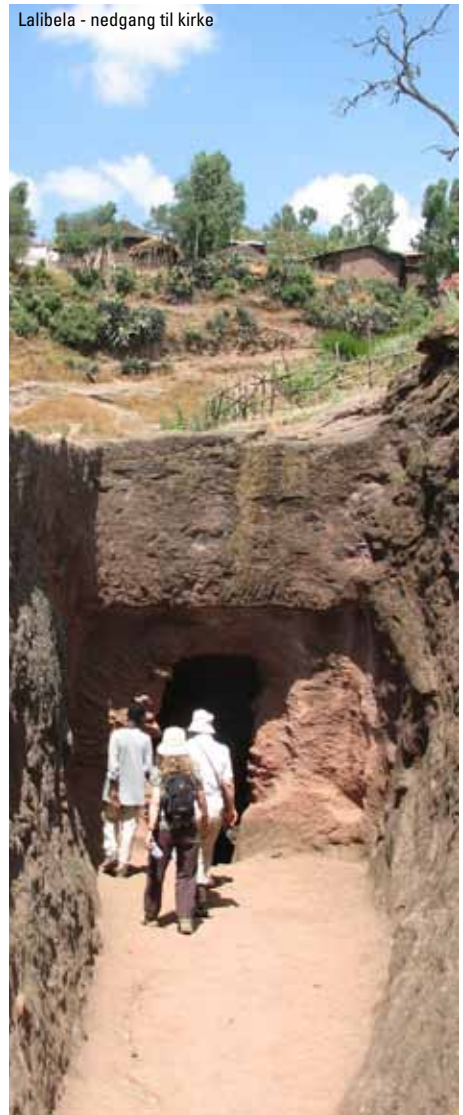
Lalibela - nedgang til kirke

Fortsat besøg i Rift Valley. Dagen slutter med, at vi kører tilbage til lufthavnen i Addis, hvorfra vi flyver til Danmark.