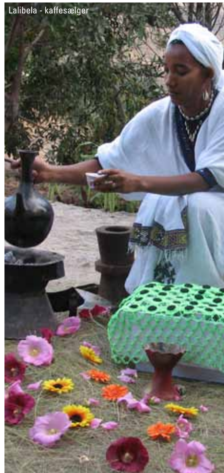
Lalibela - kaffesælger

Lalibela anses for at være én af Afrikas største attraktioner og er en af denne rejses absolutte højdepunkter. Lalibela blev grundlagt i begyndelsen af 1200-tallet af kong Lalibela. Intentionen var at befæste et nyt dynasti, ved bygge et nyt Jerusalem, efter at korstogsriddere i 1187 havde tabt Jerusalem til Saladin. Tilbage står i dag 11 kirker, som hverken blev bygget af sten eller tegl, men hugget ud dybt nede i den flade klippe. Lalibelas unikke arkitektur er et af de steder, som må opleves, og som kun forstås, når man ser det i virkeligheden. Lalibela er endvidere et af de vigtigste pilgrims mål i Etiopien.